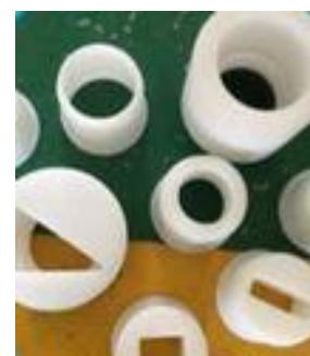
Různé tvary trysky

# Mohly by vás zajímat i jiné související zařízení – Napište, Zavolejte.